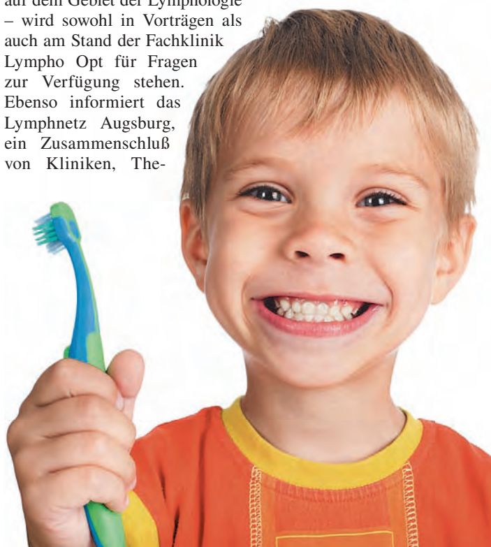
Zahngesundheit bei Kindern und Erwachsenen: Vom 1 x 1 des Zähneputzens bis zu Implantaten decken die Intersana-Themen jeden Bereich ab.

Vorträge und Expertengespräche. Fragen sind erwünscht! Sprechen Sie mit Gleichgesinnten. Auch viele Besucher sind offen für Gespräche. Eine offene und harmonische Atmosphäre ist garantiert! Der weiteste Weg lohnt sich.