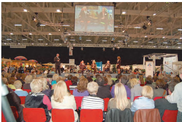
Blick auf die Aktionsbühne: Expertengespräche: Sie fragen – Experten antworten.

Die Auswahl an Vorträgen ist diesmal so groß wie nie zuvor