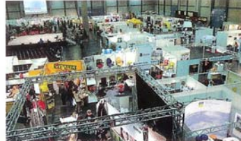
Hell und modern repräsentierte sich die Intersana im Messezentrum.

Analyse, Beratung, Betreuung: unabhängig erfahren persönlich seit 1984 für unsere Kunden tätig