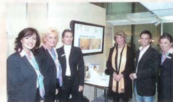
Das Team der Moser-Klinik legte sich ins Zeug und hatte guten Zulauf auf der Intersana.